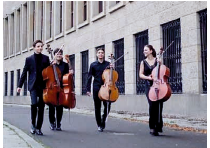
Das „2Cities Celloquartett“ begeistert sein Publikum mit einem außergewöhnlichen Klangerlebnis – in Kürze auch auf Mertingens Bühne.