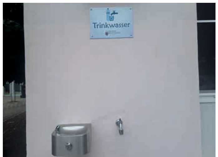
Der neue Trinkwasserspender befindet sich auf dem Schulgelände der Antonius-von-Steichele-Grundschule.

Kürzlich wurde auf dem Schulgelände am Pausenhof ein neuer Trinkwasserspender installiert, der allen Bürgerinnen und Bürgern stets frisches Trinkwasser und eine wohltuende Erfrischung bietet. Somit stellt die Gemeinde Mertingen nun zwei öffentliche und kostenlose Trinkwasserstationen zur Verfügung. Eine weitere Station befindet sich am Römerplatz.