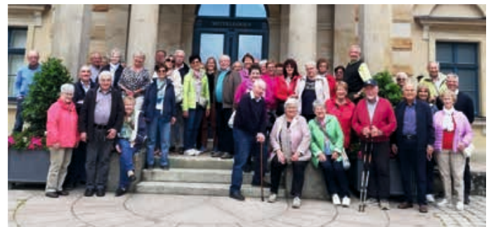
Die Senioren erlebten einen schönen Tag in der Kulturstadt Bayreuth.