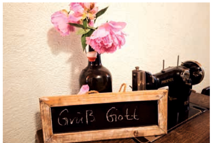
Die Pfarreiengemeinschaft Schmutter-Lech lädt herzlich zu den Ausflügen ein.

Am Samstag, den 28. Juni, findet der 2. Männerausflug der PG Schmutter-Lech statt. Treffpunkt ist um 14.00 Uhr am Pfarrheim in Mertingen. Um 14.15 Uhr kann man sich auch in Bäumenheim an der Antoniuskapelle der Fahrradgruppe anschließen. Das diesjährige Ziel ist das 1387 erbaute Marienmünster in Kaisheim. Am Ziel angekommen, wird Franz Oppel durch das 638 Jahre alte Gotteshaus führen. Anschließend steht der Besuch eines Biergartens zur Stärkung und für den persönlichen Austausch auf dem Programm. Die Fahrtstrecke beläuft sich auf ca. 35 km, die Rückkehr nach Mertingen ist für ca. 20.30 Uhr geplant. Sollte es regnen, findet der Treffpunkt am Pfarrheim in Mertingen statt, um Fahrgemeinschaften für die Anreise mit dem Auto zu bilden. Zur besseren Planung bittet die PG um Ihre Anmeldung im Pfarrbüro in Asbach-Bäumenheim (Tel. 0906/7001550), damit bei unsicherer Wetterlage eine Kontaktaufnahme möglich ist. Die Männergruppe der PG Schmutter-Lech freut sich über eine zahlreiche Teilnahme.