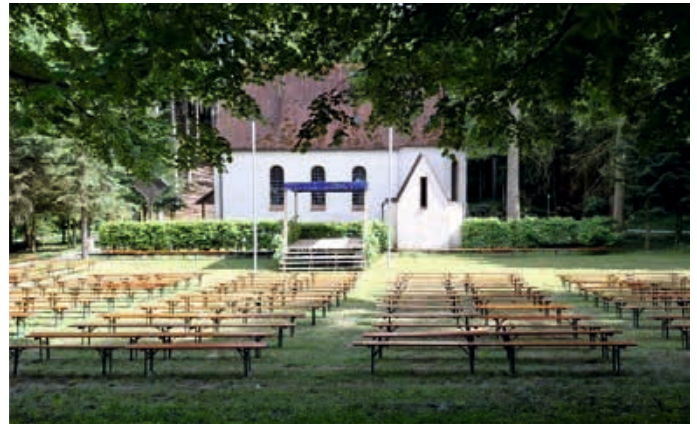
Unter dem Motto Glauben und Gemeinschaft lädt die PG zu einer spirituellen Radwallfahrt zur Kapelle Maria im Elend ein.

Die Kapelle, umgeben von Wiesen und Wäldern, wurde im 17. Jahrhundert errichtet und entwickelte sich im Laufe der Zeit zu einem beliebten Wallfahrtsziel. Sie ist tief verwurzelt mit der Region – und mit ihr eine ganz besondere Geschichte: die des Kuhhirten Nikolaus Kiegele, dessen Glauben und Vision den Grundstein für die heutige Wallfahrt legten. Die Wallfahrt soll Gelegenheit geben, sich innerlich zu sammeln, Glauben zu teilen und in Bewegung zu kommen – körperlich wie geistlich.