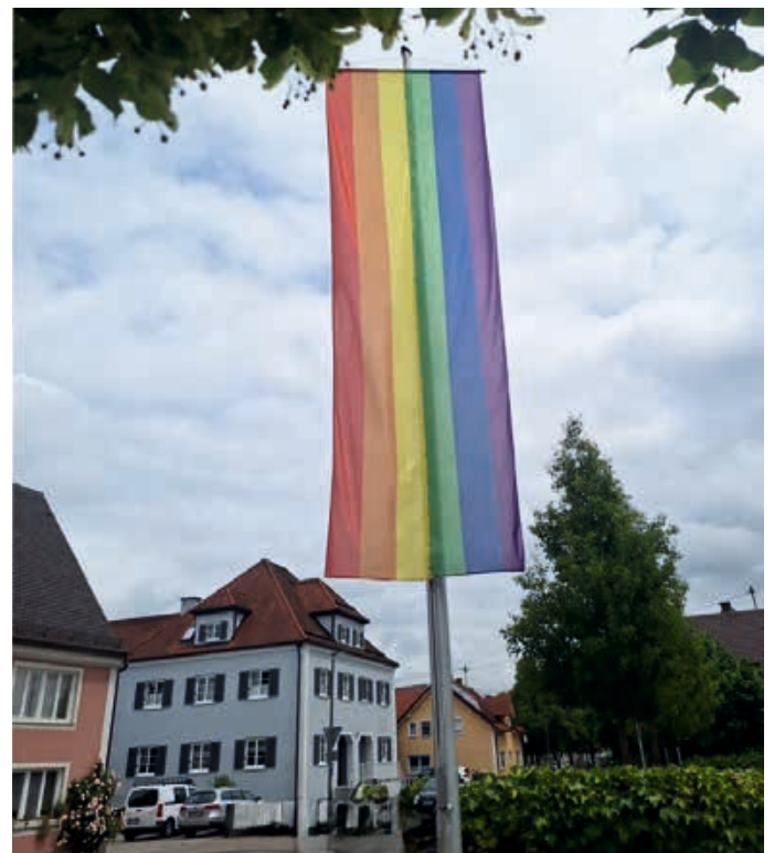
Die Gemeinde Mertingen setzt ein Zeichen für Vielfalt und Toleranz.

Im Sinne dieses Bewusstmachens hängt im Juni, dem sog. Pride-Month, am Rathaus eine Regenbogenflagge.