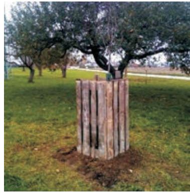
Zur Nachahmung anregender Baumschutz