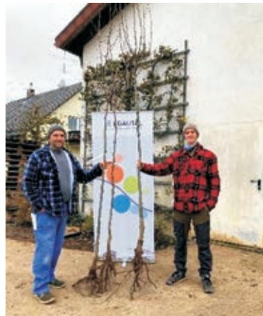
Die Abholung der Bäume