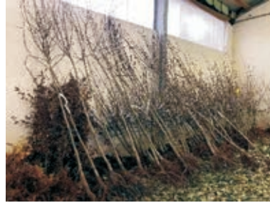
Bereit zur Abholung