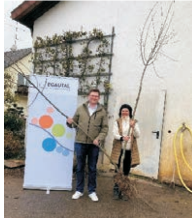
Die ILE Egautal vor Ort