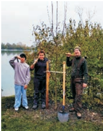
Die Jugend Fischereiverein Wittislingen e.V.