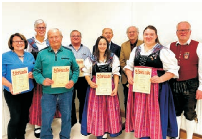
Der Musikverein ehrte langjährige Mitglieder für ihre jahrzehntelange Treue.