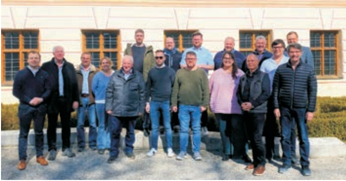
Die Teilnehmerinnen und Teilnehmer des Strategieseminars Dorferneuerung Wittislingen III.

Alle Teilnehmenden des Seminars waren sich zudem einig, künftig auch die Kommunikation der Dorferneuerung und daraus vollzogene Maßnahmen gegenüber der Bevölkerung auszubauen und zu verbessern.