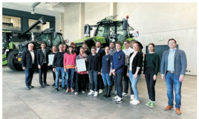
Gruppenfoto nach der Urkundenunterzeichnung