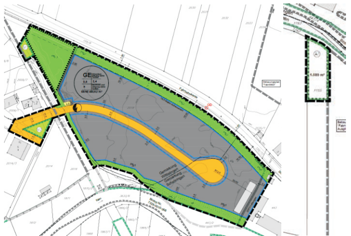
Ausschnitt Entwurf des Bebauungsplans „Papiermühlfeld“ – 4. Änderung vom 24.01.2023 mit Ausgleichsfläche im sonstigen Geltungsbereich, unmaßstäblich, genordet

Der Geltungsbereich ergibt sich aus dem Planentwurf vom Ingenieurbüro Gansloser GmbH & Co. KG vom 24.01.2023 und umfasst Teilflächen der Grundstücke Flur-Nr. 1994, 2009/2, 2013, 2018 und 215/26 der Gemarkung Wittislingen sowie eine Teilfläche des Grundstücks Flur-Nr. 443 der Gemarkung Schabringen und ist folgend dargestellt. Die planexterne Ausgleichsfläche befindet sich auf Flurstück 1155, Gemarkung Wittislingen, ebenfalls folgend dargestellt.