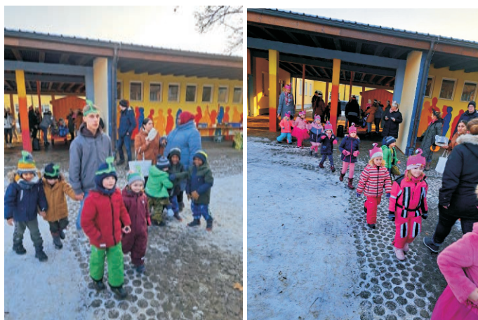
Thomas Reicherzer Erster Bürgermeister