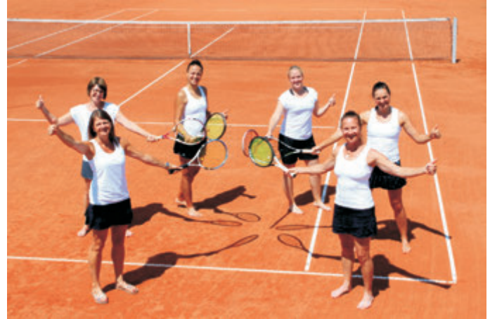
Die Damen 30 des TSV Offingen freuen sich über dem Meistertitel in der Bezirksklasse 1.

Nicht viel zu holen war dieses Wochenende leider für die Jugendteams des TSV. Sowohl die Junioren (0:6 gegen den FC Gundelfingen) als auch die Juniorinnen (0:6 gegen den TC Mertingen) blieben ohne Matchgewinne. Die Juniorinnen konnten sich aber dennoch darüber freuen, die Saison auf einem tollen zweiten Tabellenplatz abgeschlossen zu haben.