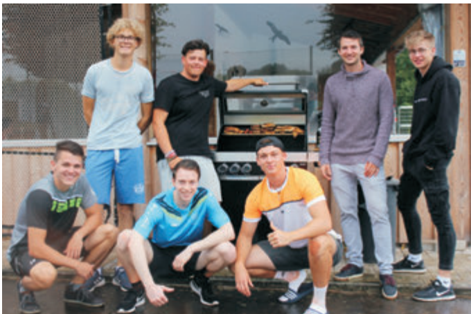
Die Herren 1 des TSV Offingen haben die knappe Niederlage schnell verkraftet