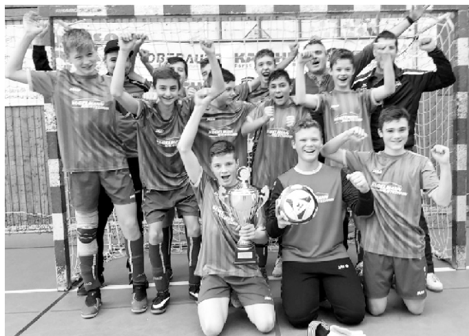
(C-Jugend der SG Gundremmingen nach dem Sieg bei den Hallenkreismeisterschaften)

In einem spannenden Finale wurde der TSV Krumbach im Sechsmeter- schießen mit 2:1 bezwungen. Damit sind die Jungs Hallenkreismeister!!! Als Hallenkreismeister war die C-Jugend für die Nordschwäbischen Meisterschaften am 12.01.2020 in Burgau qualifiziert. Hier belegte die Mannschaft den 6. Platz.