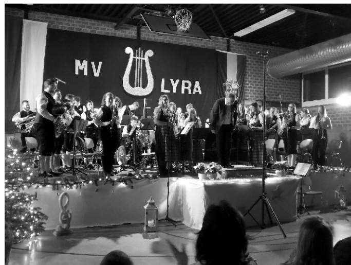
Nach getaner Arbeit nehmen Musiker und Dirigent dankend den Applaus des Publikums entgegen.