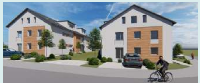
Auszug aus den Planentwürfen: Ansicht von Osten

Die Gemeinde veräußert das Grundstück des ehemaligen katholischen Kindergartens an die Firma Heinrich Hebel Wohnbau. Dort sollen zwei Mehrgenerationenhäuser mit jeweils neun Wohnungen entstehen. Die Pläne sowie eine Visualisierung werden in der öffentlichen Gemeinderatssitzung im März vorgestellt.