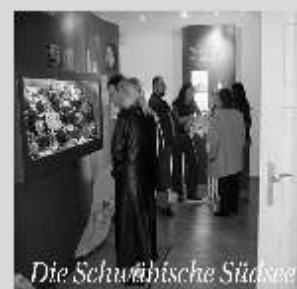
Die Schwäbische Südssee

Geöffnet jeden 1. Sonntag im Monat von 14.00 – 17.00 Uhr