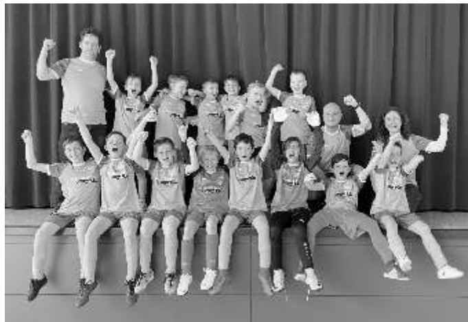
Die Mannschaft der Wiesbühlschule