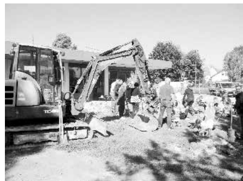
Text und Foto: Johannes Schaufler, Stadtpfarrer

Mögen die Arbeiten zügig voran gehen und unter der schützenden Hand Gottes stehen!