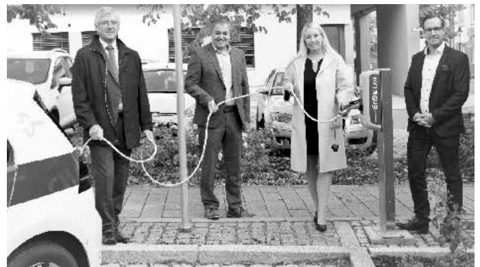
Offizielle Inbetriebnahme der E-Ladesäule in Gundelfingen:

ODR-Kunden können sogar doppelt sparen: beim Kauf eines E-Autos erhalten Sie von der ODR einen Bonus in Höhe von 270€. Alle Informationen hierzu finden Sie hier: ( https://www.odr.de/privatkunden/tarife-produkte/e-mobilitaet/E_mobilitaet_Aktion.html#content )