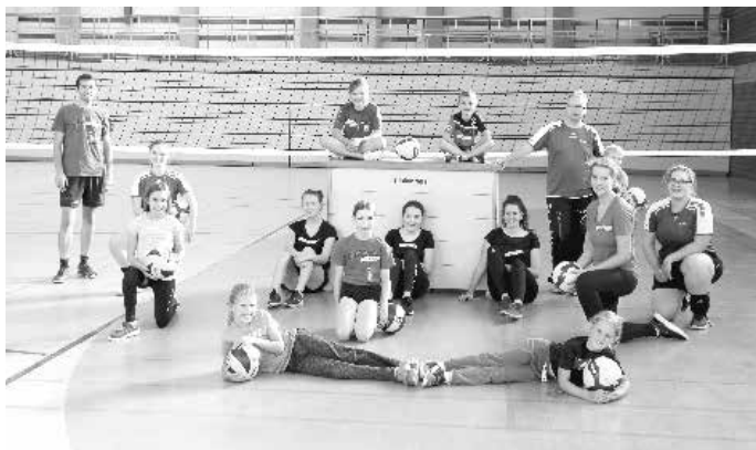
Volleyballspaß beim Gundelfinger Ferienprogramm.