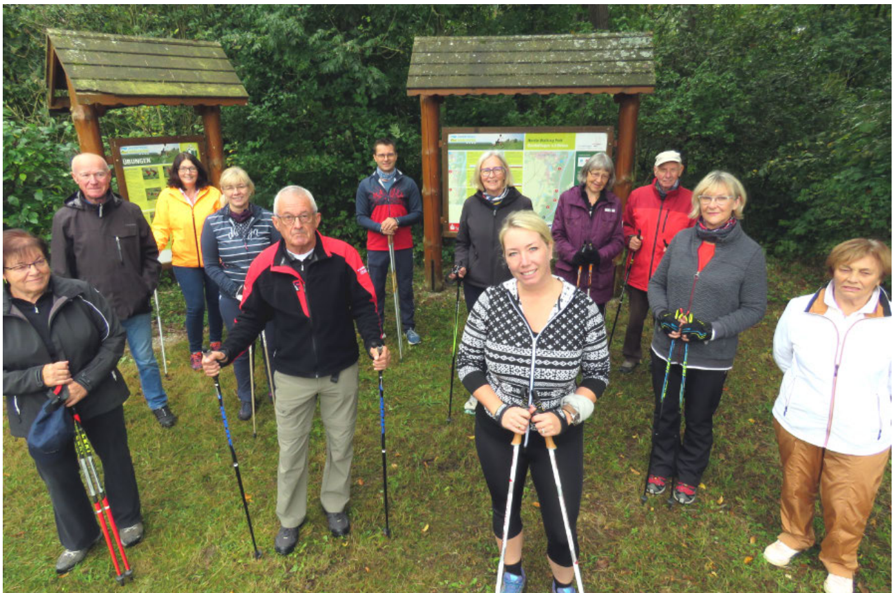
Bürgermeisterin Miriam Gruß (Mitte) ließ es sich nicht nehmen, auf eine Nordic Walking Runde zu gehen, um die neuen Schilder zu begutachten.

Der Nordic Walking-Park im Gundelfinger Auwald wurde 2006 eröffnet und umfasst insgesamt sechs Strecken, die zwischen 2,5 und 16,9 Kilometer lang sind. Für Interessierte bietet unter anderem der Kneipp-Verein vhs-Kurse zum Thema Nordic Walking an. Auf der Homepage der Stadt findet man zudem einen Übersichtsplan mit Streckenverlauf und Höhenprofil zum Download unter: https://www.gundelfingen-donau.de/wp-content/uploads/2019/04/GeomGundelfingenStarttafel_05.pdf