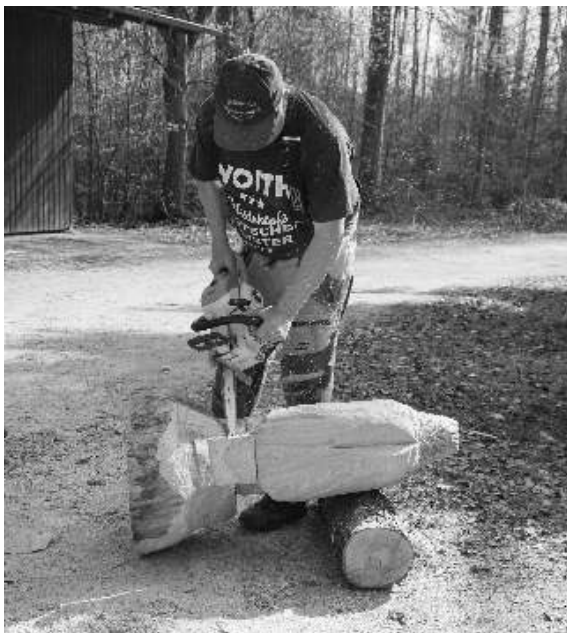
Workshop „Schnitzen eines Adlers“