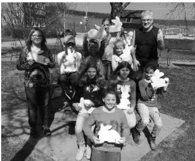
Kurs „Bastle dir einen schönen Osterhasen oder einen Gartenstecker aus verschiedenen Ytong-Stein-Körpern“