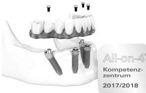
Die Praxiszahnklinik Günzburg ist seit dem 1. August 2016 zertifiziertes All-on-4® Kompetenzzentrum.

Wenn der Patient über genügend Kieferknochen verfügt, setzt der Implantologe vier Implantate in einem bestimmten Abstand und einem genau definierten Winkel ein. Diese Konstruktion ist so stabil, dass die Patienten noch am selben Tag mit einer festsitzenden Brücke und individuell angepasstem Zahnersatz nach Hause gehen können. Dieser erste Zahnersatz kann schon am gleichen Abend belastet werden. Es gibt allerdings Patienten, deren Angebot an Kieferknochen für eine normale Implantation nicht ausreicht. Auch auf diese Situation ist das Team bestens vorbereitet und