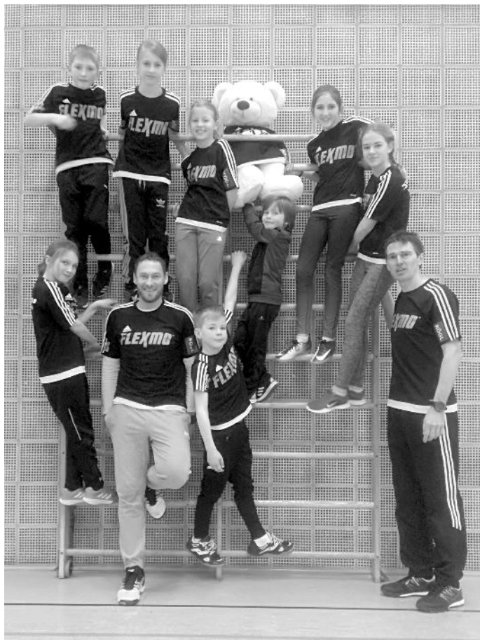
Das Offinger Mehrkampfteam mit Maskottchen Felxi