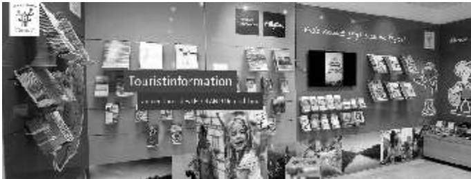
Prospektauslage Touristinfo LEGOLAND Allee

An einer Prospektauslage interessierte Anbieter, können sich bis zum 2. März einen Platz sichern bzw. das entsprechende Buchungsformular bis dahin ausgefüllt an die RMG senden. Das Buchungsformular (es sind verschiedene Formate und Auslagezeiträume wählbar) steht unter www.familien-und-kinderregion.de/service/interne bereit. Gesellschafter der RMG profitieren von ermäßigten Preisen. Die Vergabe der Auslageplätze erfolgt in der Reihenfolge der Anmeldungen. Nach Erhalt der Buchungsbestätigung können ab Montag, 19.03. bis Freitag, 23.03. in der Zeit von 9-12.30 und 13-17.30 Uhr und dann ab Samstag, 24.03. zu den regulären Öffnungszeiten (täglich 9.30-13 und 14-18.30 Uhr) die Prospekte an der Touristinfo LEGOLAND, LEGOLAND Allee, 89312 Günzburg angeliefert werden. Weitere Infos: Carina Huch, Leiterin Touristinfo LEGOLAND Allee bei der RMG, Tel. 08221/95-141, c.huch@landkreis-guenzburg.de .