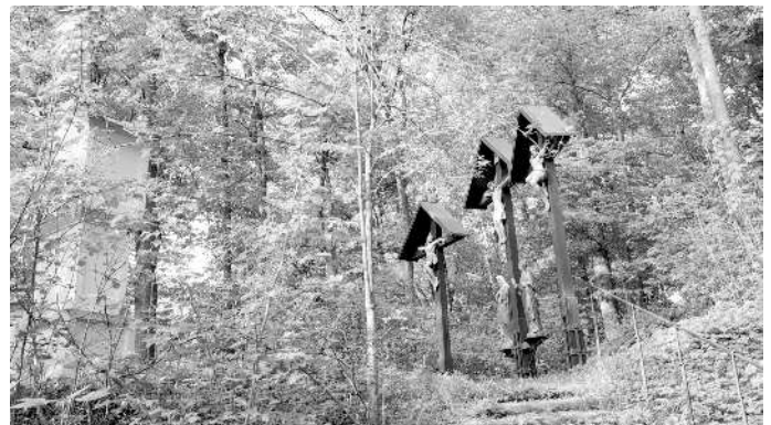
und die Kreuzigungsgruppe auf dem Hochplateau.