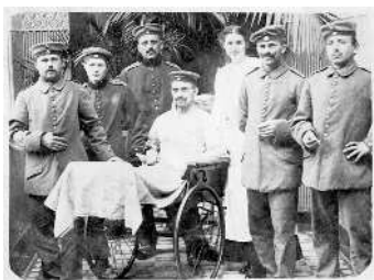
gelbufen, 5. 7. 1915

Sonderführungen unter Tel.: 08224/1271 oder 08224/1229