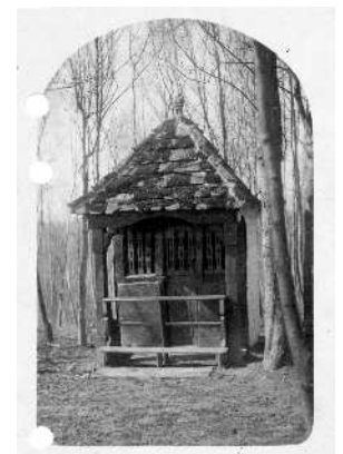
Waldkapelle „Holzherrgöttle“