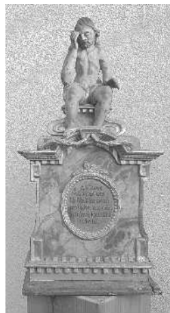
„Heiland in der Rast“