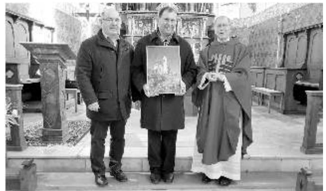
Bildunterschrift von rechts nach links: