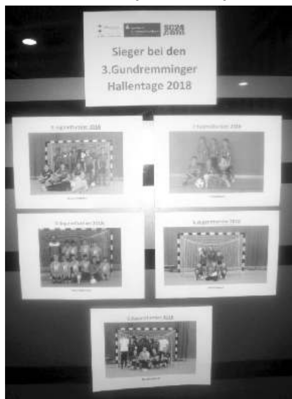
Die Siegermannschaften bei den 3. Gundremminger Hallentage 2018

Ganz besonderer Dank an alle Helfer im Verkauf bzw. an die Turnierleitung, welche an allen drei Turniertagen für einen reibungslosen Ablauf sorgten.