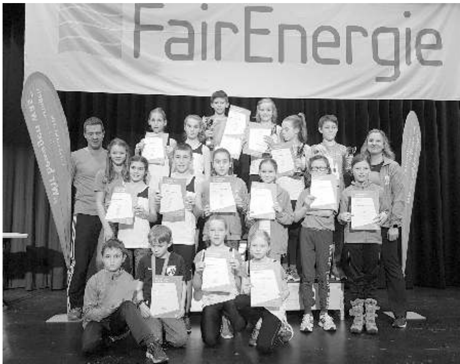
Erfolgreiche Mannschaft der Leichtathleten beim FairEnergie-Cup