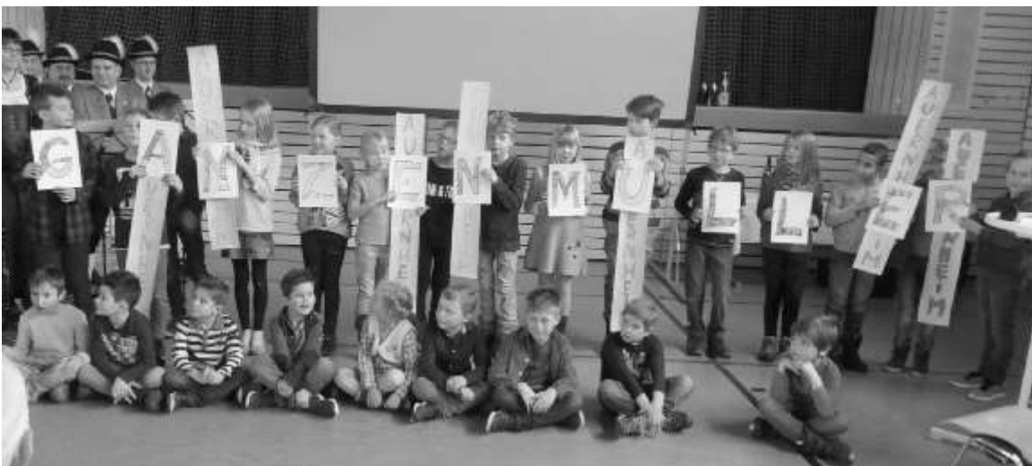
Die Kinder der Grundschule Auernheim