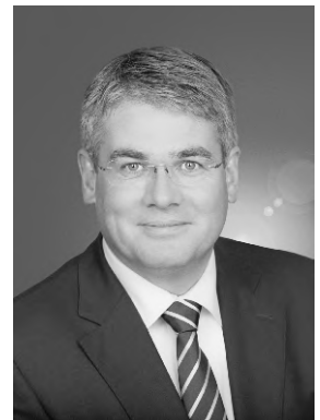
Winfried Mack MdL