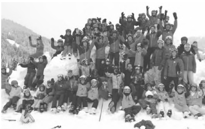
Die DSV-Skischule der TSG Nattheim Abteilung Ski war an drei Kurstagen mit fast 70 Skischülern am Riedberger Horn.

Skikurs auf die Beine gestellt, das macht Lust auf mehr, spätestens in der nächsten Saison 2018/2019 wollen alle wieder dabei sein.