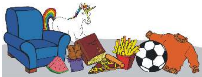
Illustration: Melanie Potosk

Die Sonderausstellung des Bezirks Schwaben in Schloss Höchstädt (1. April bis 14. Oktober, täglich außer montags von 9.00 bis 18.00 Uhr) zeigt als eine Art begehbare Poesiealbum verschiedene Lieblingsdinge von großen und kleinen Schwaben - inklusive einer kleinen Zeitreise zu den Lieblingsdingen vergangener Jahrzehnte. Familien lädt ein umfangreiches Rahmenprogramm zu Lieblings-Theaterstücken und - Geschichten ein. Medien- und Mitmachstationen bieten vielfältige Aktivitäten.