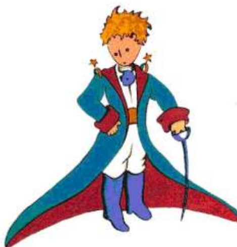
Bild: Antoine de Saint-Exupéry, Der kleine Prinz