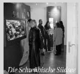
Die Schwäbische Silassee

Geöffnet jeden Sonntag von 14.00 – 17.00 Uhr