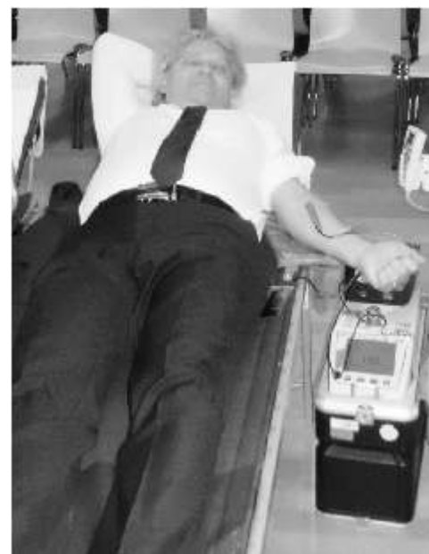
Nach der Blutspenderehrung machte unser Bürgermeister seine 50. Blutspende. Das DRK sagt: Danke!