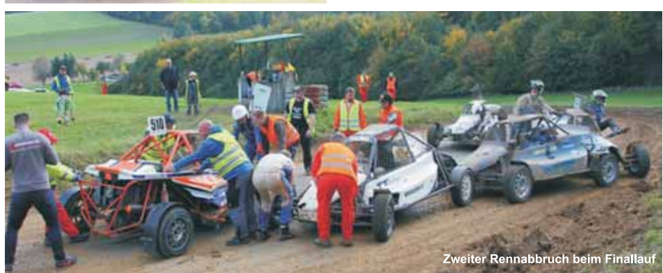
Zweiter Rennabbruch beim Finallauf