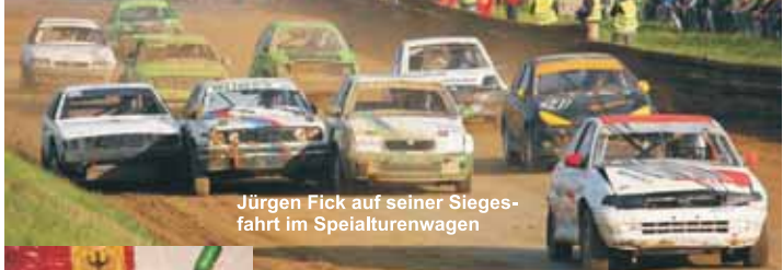
Jürgen Fick auf seiner Siegesfahrt im Spezialtourwagen

Grundsätzlich blickt der Motor-Club Kesseltal auf dieses erlebnisreiche Wochenende zufrieden zurück. Durch den vielen Regen in der Nacht wurde es am Sonntagmorgen sehr schwer für die Fahrzeuge ohne Allrad den Kurs zu bewältigen. Durch die Zeitverzögerungen konnte auch das klassische Superfinale des MCKs nicht mehr durchgeführt werden. Für die Zuschauer war es ein sehr langer Rennsonntag mit optimalen Wetterbedingungen.