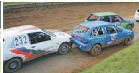
Stefanie Geiger im Kampf um eine bessere Platzierung