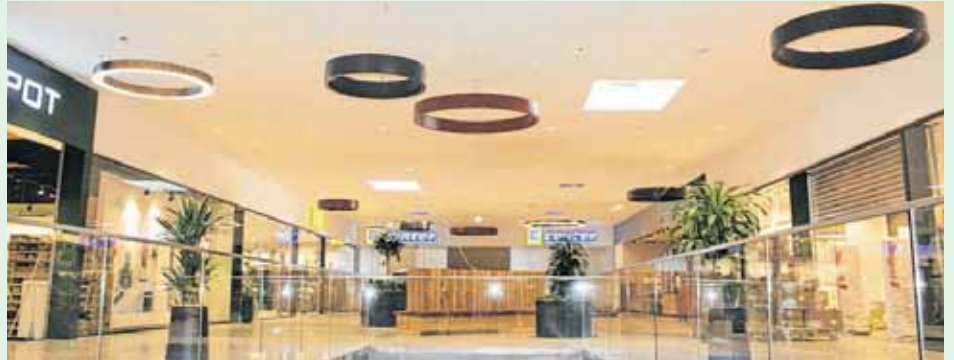
Durch die neuen Räumlichkeiten zieht sich ein klares Designkonzept. Hell, einladend und voll von grünen Akzenten begrüßt das Einkaufszentrum ab sofort seine Besucher.