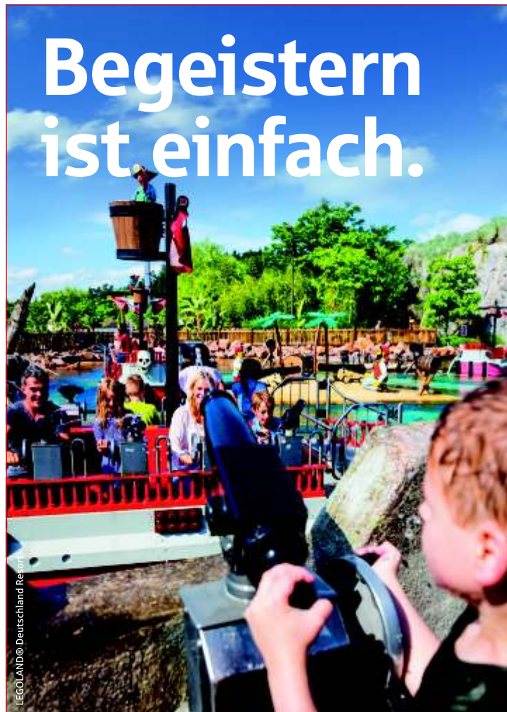
LEGOLAND Deutschland Resort