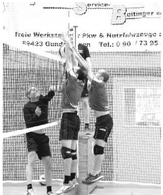
Abschlussturnier in der Kreissporthalle