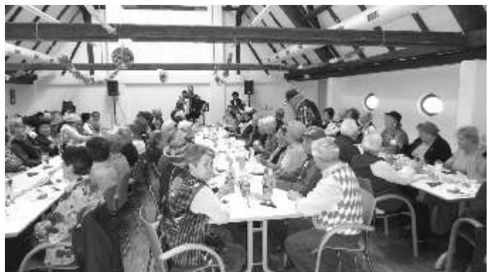
Foto vom Seniorenfasching 2011

Der Eintritt ist frei. Gönnen Sie sich wieder bei Kaffee und Kuchen sowie Getränken aller Art einige unterhaltsame Stunden.