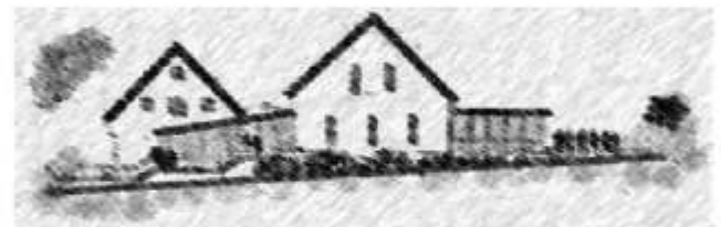
Vereinsgemeinschaft Zehntstadel Dattenhausen e.V.